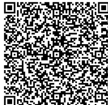
ストリートビュー