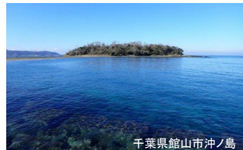
千葉県館山市沖ノ島

千葉県館山市沖ノ島(沖ノ島公園)は、館山湾の南側に位置する陸続きの 周囲約1キロの小さな無人島。黒潮の影響が強く、北限域のサンゴや多くの 海辺の生きものが生息しています。暖温帯の豊かな海浜植物、照葉樹を中心 とした森が形成され、そこには首都圏からそう遠くないにもかかわらず、 豊かな生態系が存在します。 しかし、近年自然環境に変化が起きています。海草や海藻の減少、2019年 の台風による風倒木が発生し、私たちは海と森の再生活動をするともに、 それを多くの人に伝える活動をしています。