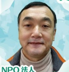
NPO 法人 海辺つくり研究会 理事長