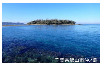
千葉県館山市沖ノ島

千葉県館山市沖ノ島(沖ノ島公園)は、館山湾の南側に位置する陸続きの 周囲約1キロの小さな無人島。黒潮の影響が強く、北限域のサンゴや多くの 海辺の生きものが生息しています。暖温帯の豊かな海浜植物、照葉樹を中 心とした森が形成され、そこには首都圏からそう遠くないにもかかわらず、 豊かな生態系が存在します。 しかし、近年自然環境に変化が起きています。海草や海藻の減少、2019年 の台風による風倒木が発生し、私たちは海と森の再生活動をするともに、 それを多くの人に伝える活動をしています。